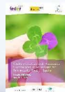
Estudio Enserio 2017

INNOV Care Proyecto Europeo 2015_2018 www.innovcare.eu