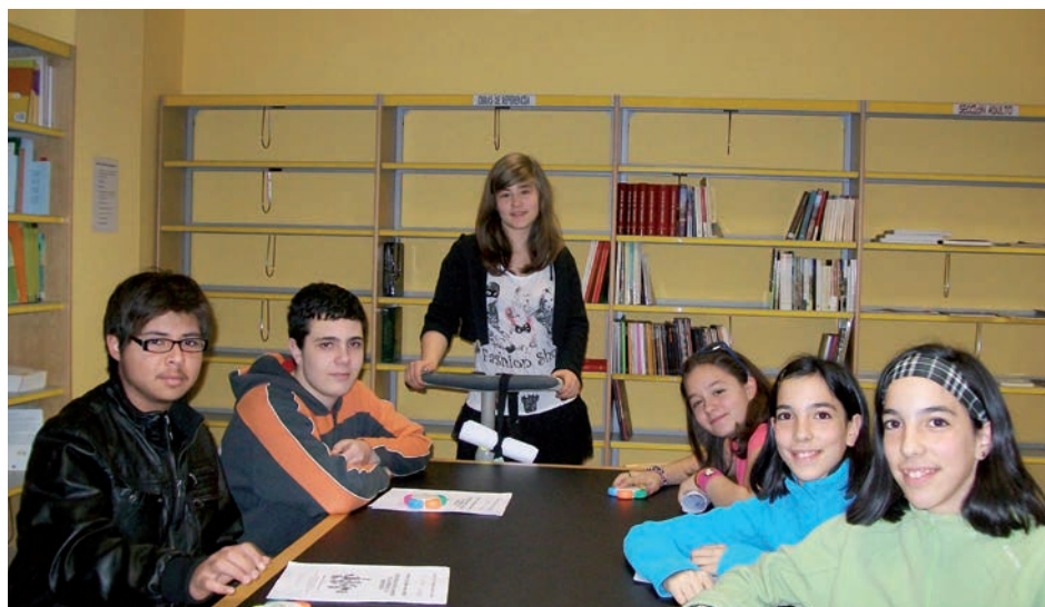
Niñas y niños del Grupo B