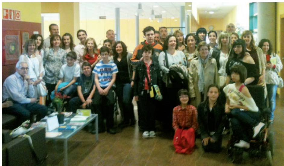
Algunos participantes del Proyecto en la última sesión

pacidades de los niños y niñas que participaron en el Programa y de todo los niños/as con ER, discurran por los cauces de confianza, normalidad y estabilidad emocional que toda persona merece y necesita en las primeras etapas de su vida.