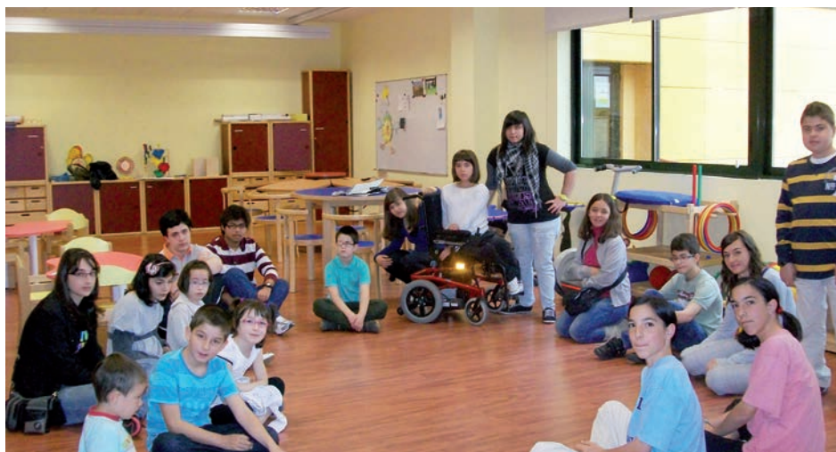
Los niños y niñas del Programa en una actividad de tiempo libre

Los Cuestionarios de Evaluación reflejan que las actividades del Proyecto han ayudado a padres, profesores y niños a mejorar actitudes de apoyo ante las necesidades educativas de los niños con ER y al afrontamiento de dificultades y situaciones de tensión que se generan en torno a esta problemática.